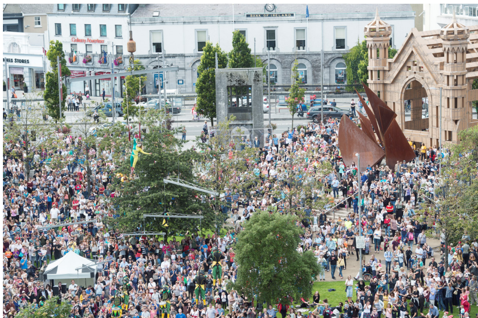
Leagan na nDaoine, An Fhaiche Mhór, Féile Idirnáisiúnta Ealaíon na Gaillimhe The People's Build, Eyre Square, Galway International Arts Festival