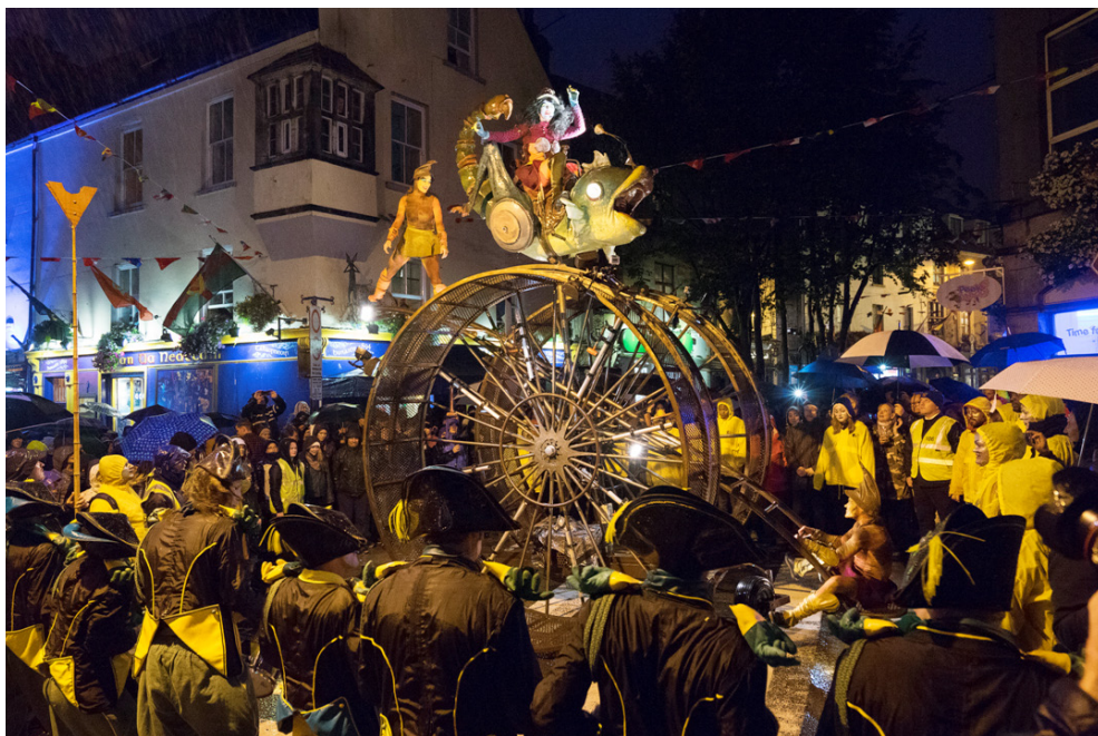
Feile Idirnáisiúnta Ealaíon na Gaillimhe Galway International Arts Festival