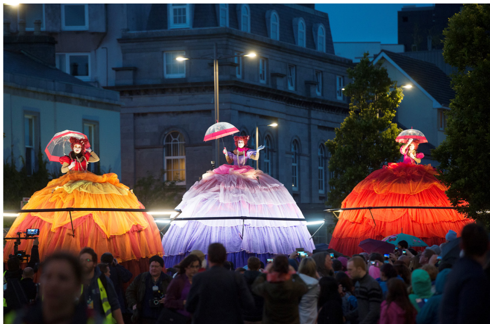
Feile Idirnáisiúnta Ealaíon na Gaillimhe Galway International Arts Festival