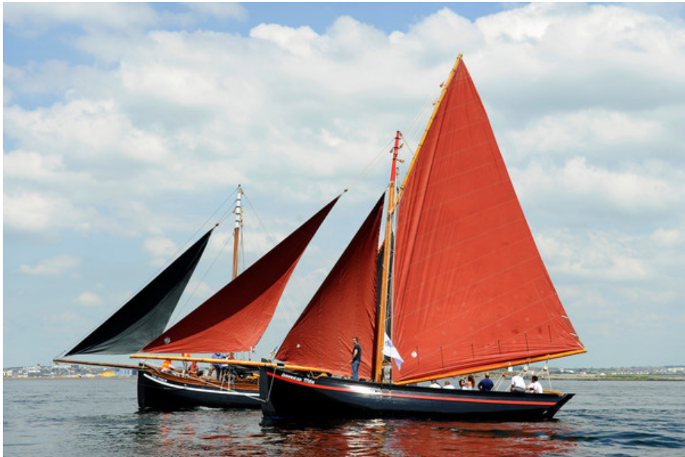
Bádóirí an Cladaigh The Claddagh Boatmen

We wish to thank everyone who has contributed to the development of “Everybody Matters” and to “Creative Galway” from the cultural, social, business, community and statutory sectors. We look forward to their continued roll-out. We look forward to continue to work closely with colleagues nationally in Creative Ireland.